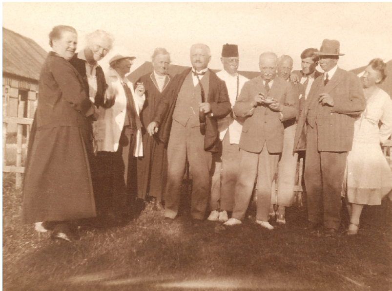
Pensionærer. Langpiben var ikke ukendt for de lokale, men fez'en er nok blevet anset for ret eksotisk.