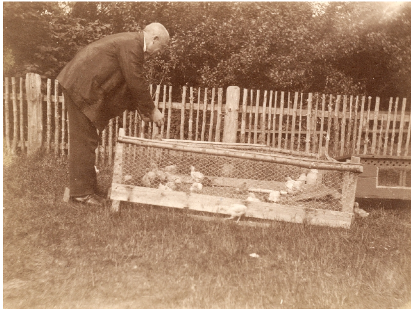
Skoleinspektør Kjær fodrer kyllinger