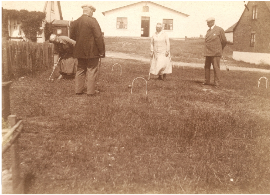
Kroket på plænen ved pensionatet