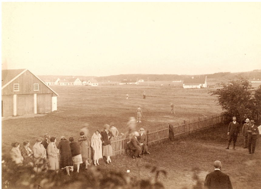
Pensionatets have, hvor der spilles bocchia, og børnene leger på marken udenfor. I baggrunden ses bl.a. husene på Fiskervej.