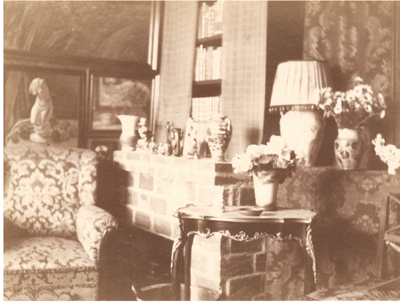
Fra Hasses lejlighed. Det kan bekræftes, at der er en del nips...