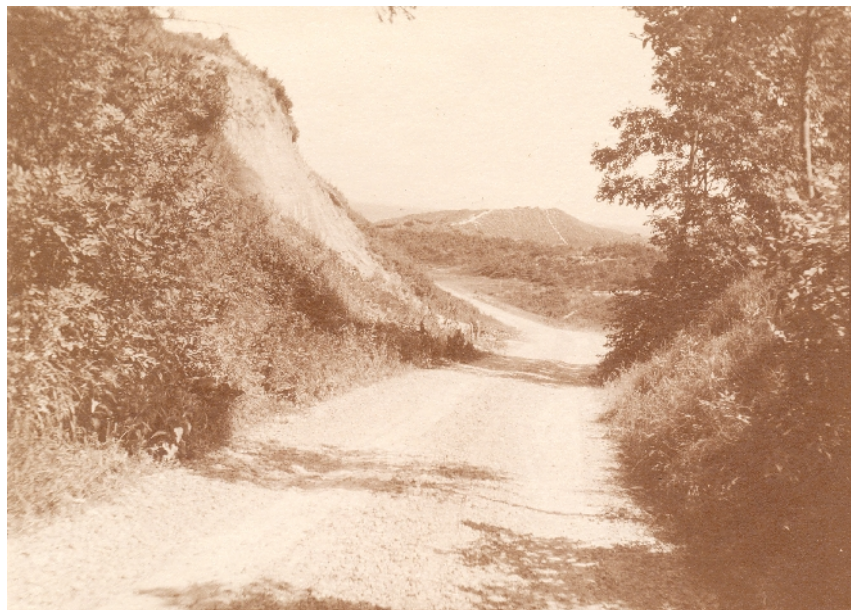
Nedkørsel ved Svinkløv