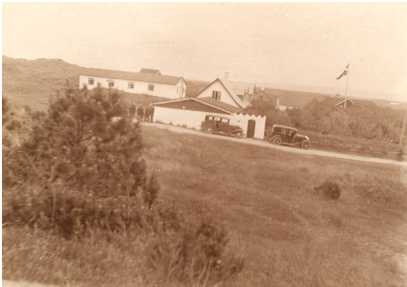
Pensionatet set fra vest